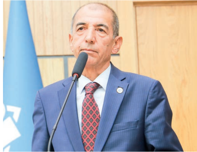
Сирожиддин САЙИД, Ўзбекистон Ёзувчилар уюшмаси раиси, сенатор:

корлик йўлида олиб борилаётган ислохотлар натижасини одамларимиз ўзининг оддий турмуш тарзида сезишмоқда. Уларнинг кайфияти кўтаринки руҳда эканлигини ва ислохотлардан, Президентимиздан халқимиз рози эканлигини кўриб, билиб турибмиз.