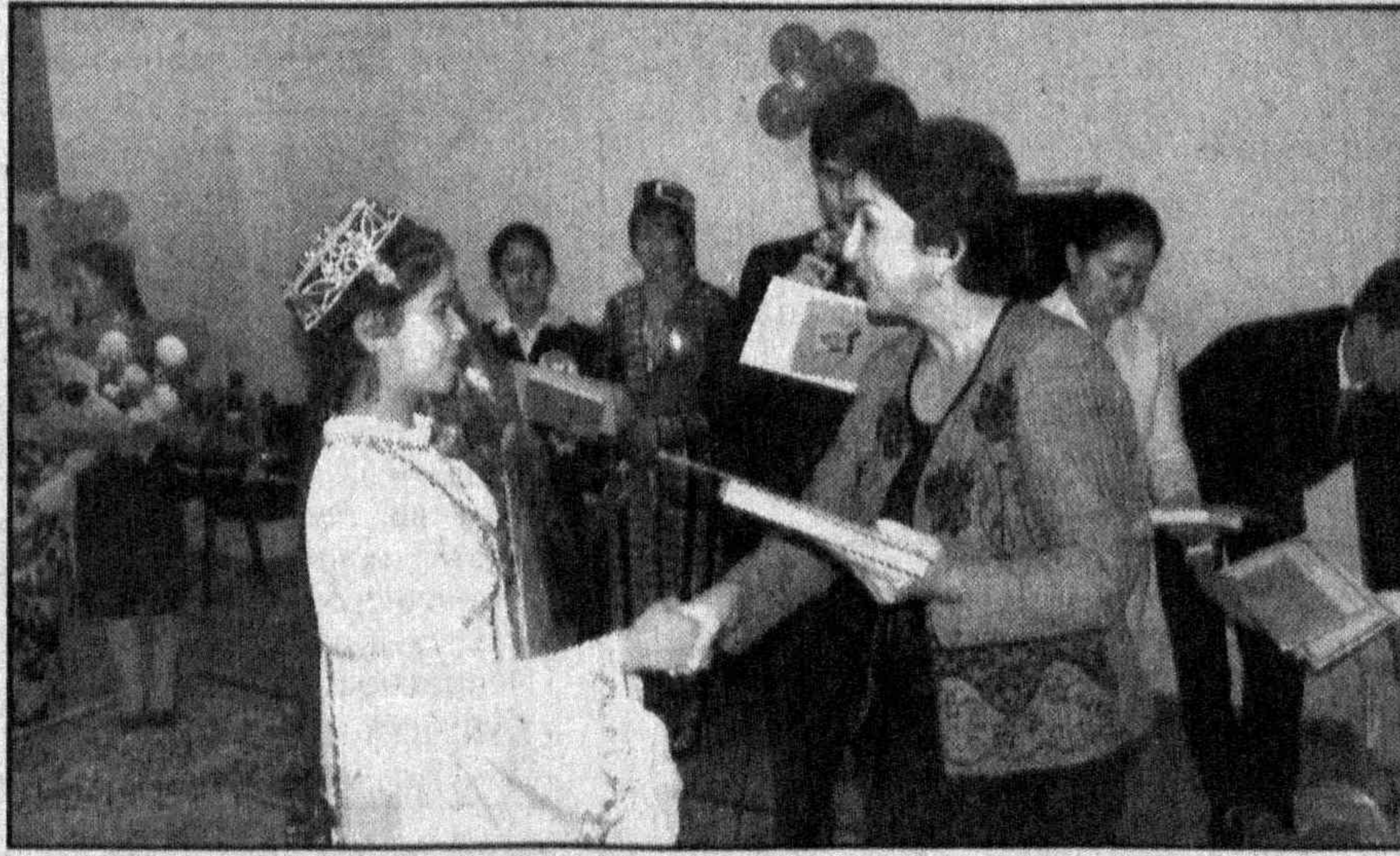
ти подали заявки на соискание этой престижной Государственной премии в этом году. Отборочный тур проводился среди учащихся школ, колледжей, лицеев и рабочих предприятий всех городов и районов области. В областной тур вышли 25 девушек, показавших наилучшие результаты.

1 июня 1999 года. С тех пор конкурс проводится ежегодно, называя имена лучших и талантливых людей. За эти годы госпремию имени Зулфии в Узбекистане получили 112 девушек, в том числе 8 из Ташкентской области. С каждым годом растет число участниц этого престижного конкурса. Более двух тысяч девушек из Ташкентской обла-