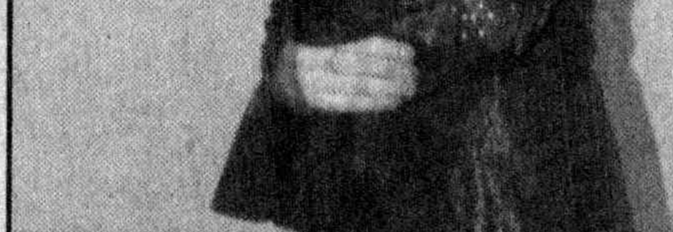
(Окончание на 3-й стр.) На снимках: во время конкурса.