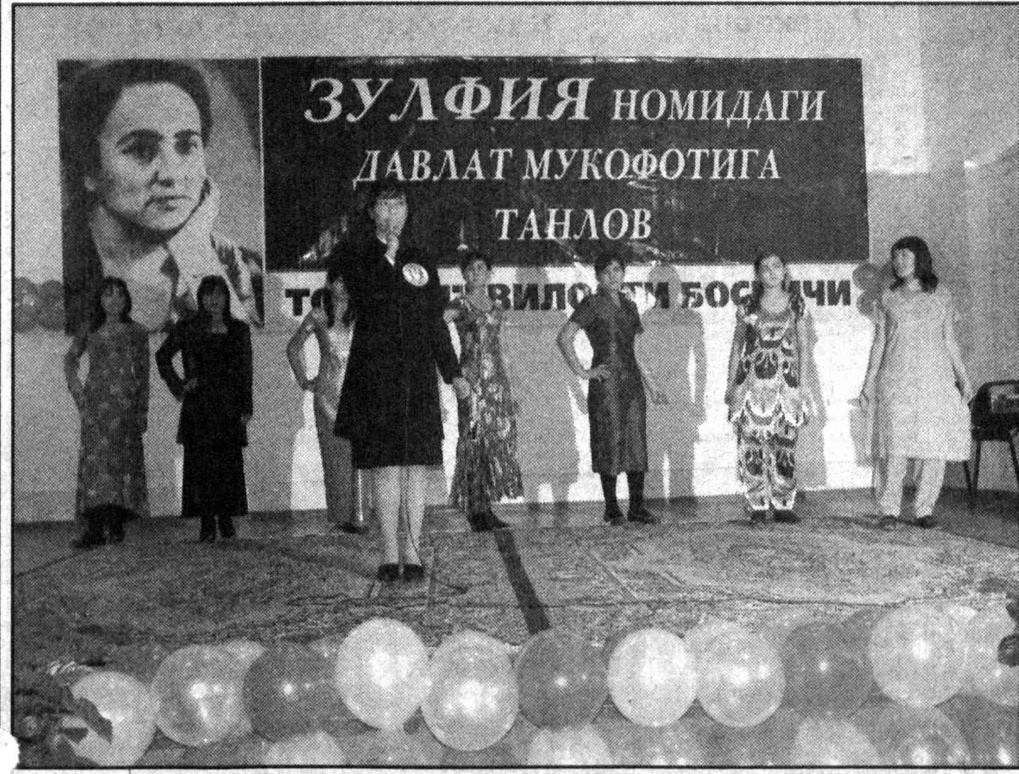
ЗУЛФИЯ НОМИДАГИ ДАВЛАТ МУКОФОТИГА ТАНЛОВ