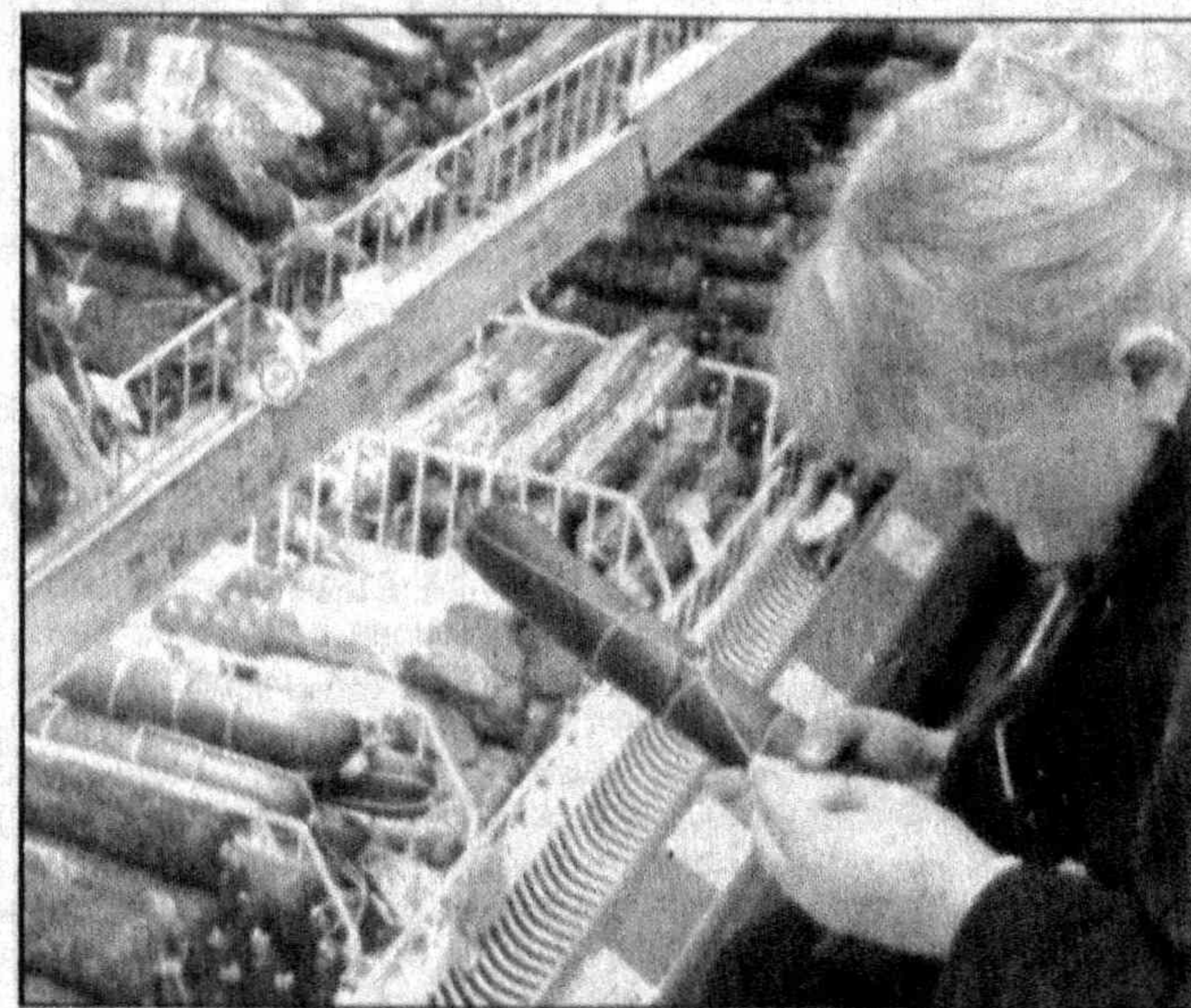
Производство фермерского хозяйства «To'htaniyoz-ota» пользуется повышенным спросом.