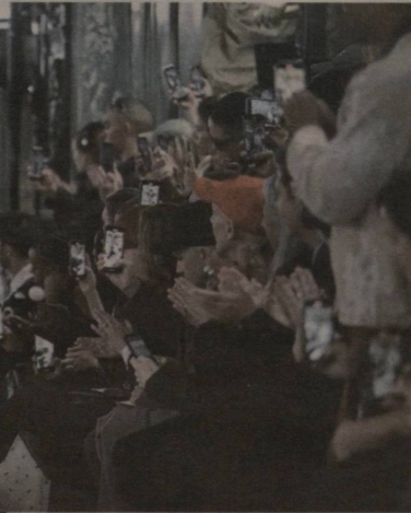
Loyiha muallifi: Ziyoda RAHIMBOYEVA

Nafaqat yoshlar, dunyoning eng boy va mashhur kishilari ham modaga doimo e'tibor qarati-shadi, hatto o'zlari yaratishlari ham hech gap emas. Ammo har qanday holatda ham bir kishi yoki jamiyatning ma'lum qatlami o'ylab topgan narsani urf bilib, ko'r-ko'rona ergashib ketaverish biroz g'alati, shu bilan birga, juda qiziq jarayon! Bugun bu mavzu yuzasidan qiziqarli ma'lumotlar bilan birga, mulohazaga undovchi fikrlarni ham muhokama qilamiz.