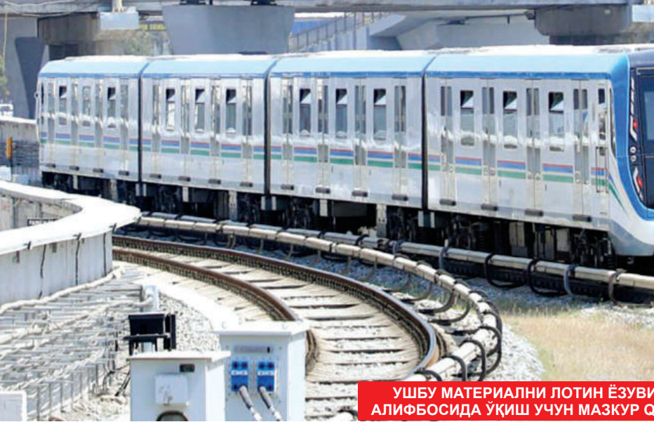
УШБУ МАТЕРИАЛНИ ЛОТИН ЁЗУВИГА АСОСЛАНГАН ЎЗБЕК АЛИФБАСИДА ЎҚИШ УЧУН МАЗКУР QR-KODНИ СКАНЕР ҚИЛИНГ.

Ҳисоб-китобларга қараганда, аҳолининг кундалик ҳаракат эҳтиёжи олти миллион катновни талаб этади. Бу эҳтиёжнинг 1,5 миллиони автобус, микроавтобуслар ва