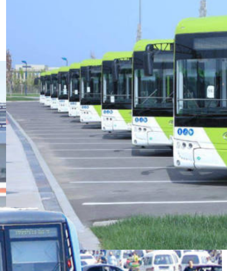
РАКАТЛАНАОТГАН ТРАНСПОРТ ОҚИМИ КАМАЙТИРИЛМАГАН ҲОЛДА ҚАЙД ЭТИЛГАН САМАРАЛАРГА ЭРИШИШ МУМКИН.

Мамлакатимизда автомобиллашган-лик даражаси 1000 кишига 86 та, Тошкент шаҳрида эса 240 тага тўғри келишини ҳисобга олсақ, ҳали енгил транспортда ҳаракатланаётган аҳолининг асосий қисми шахсий транспорт воситасига эга эмаслиги-