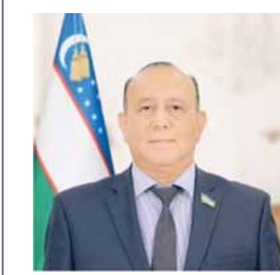
Шарофиддин НАЗАРОВ, Олий Мажлис Қонунчилик палатаси Бюджет ва иқтисодий ислохотлар қўмитаси раиси, иқтисодиёт фанлари доктори.

Мамлакатимизда иқтисодиётни барқарор ривожлантириш, бюджет, солиқ ва пул-кредит сиёсатини иқтисодий фаолликни оширишга йўналтириш, рақобат муҳитини яхшилаш ҳамда хусусий тадбиркорлик раёқини таъминлаш, товар ва молия бозорларидаги монополияни босқичма-босқич камайтириш, давлатнинг иқтисодиётга таъсирини "кешиш" орқали самарали рақобат муҳитини яратиш бўйича изчил ислохотлар амалга оширилмоқда.