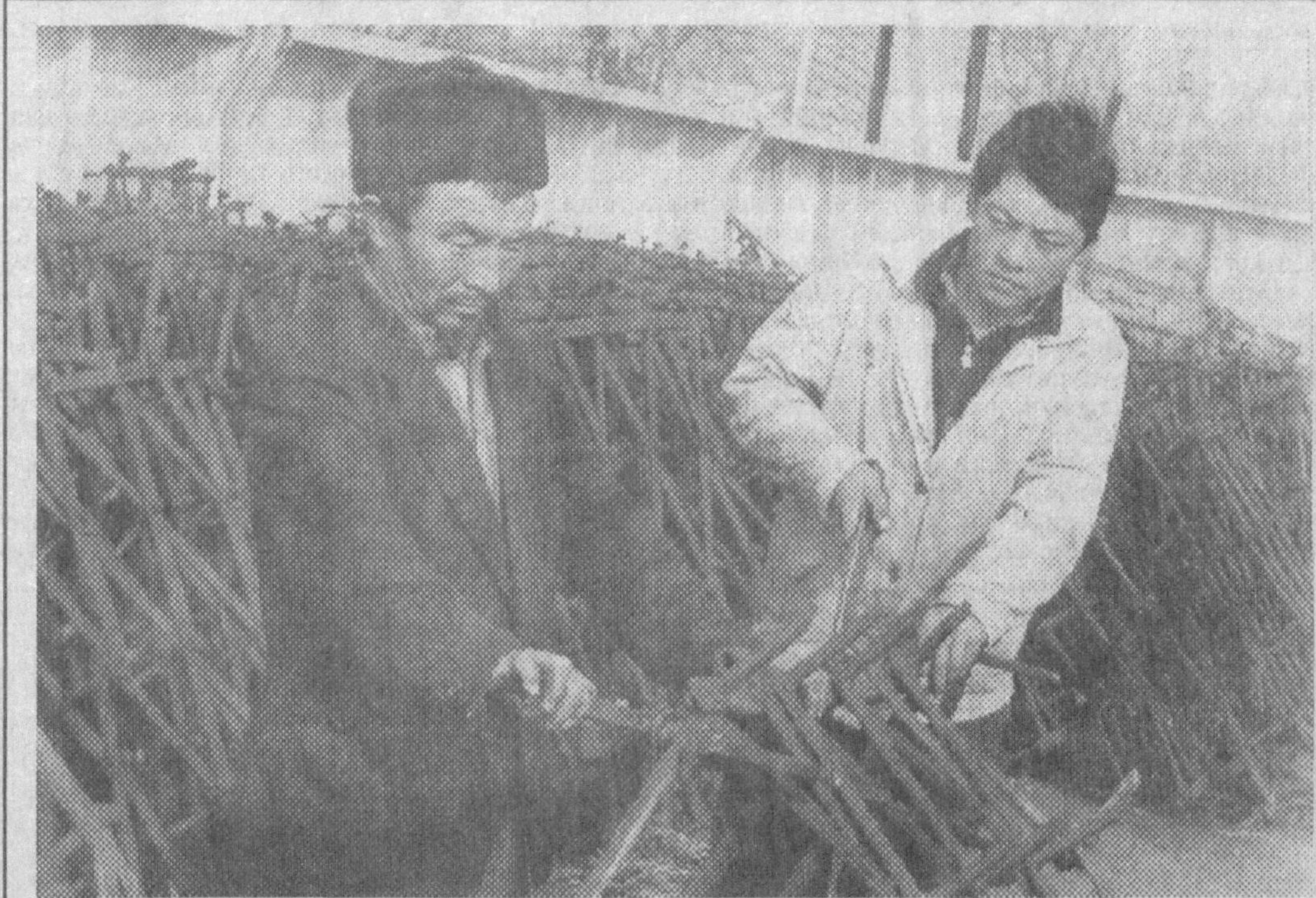
Сирдарё вилоятидаги Ш.Рашидов туманининг Ф.Ғулом номи давлат хўжалиги устaxonасида бўлган киши механизатор қизғин иши устидан чиқади. Марказий устaxonада баҳорчи экин-тиқинда ишлатиладиган техника воситалари таъмирланаётган.

нг еркин хотираси Ватан йулларини абадул-абад еритиб туражак! Азиятлар! Бугун биз Ўзбекистон Куролли кучлари ташкил топганининг олти йиллигини нишонламоқдамиз. Утган қисқа даврда миллий қушинимиз энг замонавий асосларда шаклланди. Уларнинг салоҳияти ва жанговар тайергарлиги тобора ортиб бормоқда.