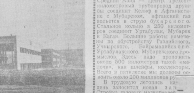
В проекте Директивы XXIII съезда КПСС по пятилетнему плану развития народного хозяйства СССР на 1966-1970 годы...