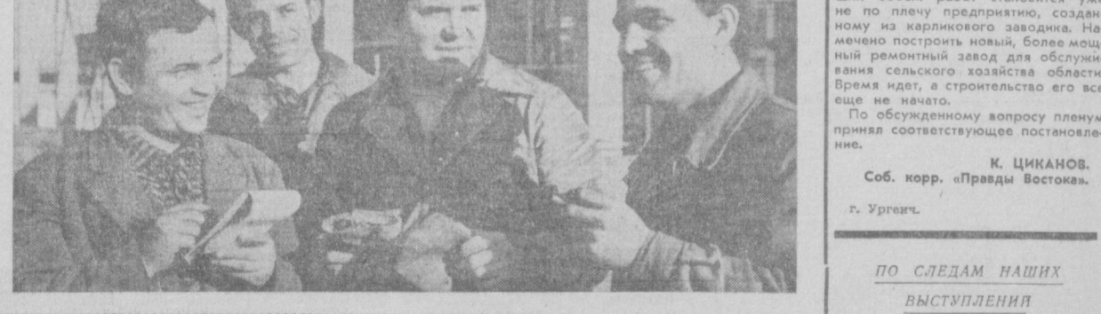
... в помощь агитатору и пропагандисту