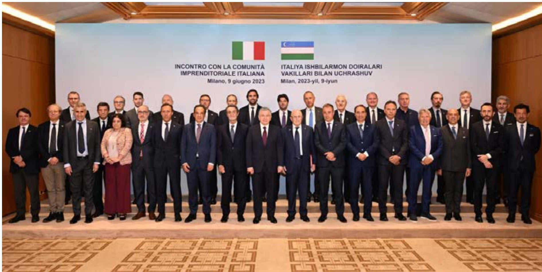
INCONTRO CON LA COMUNITA' IMPRENDITORIALE ITALIANA Milano, 9 giugno 2023 ITALIYA ISHBILARMON DOIRALARI VAKILLARI BILAN UCHRASHUV Milan, 2023-yil, 9-iyun

O'zbekiston Respublikasi Prezidenti Shavkat Mirziyoyev Italiya Respublikasi Prezidenti Serjo Mattarellaning taklifiga binoan 7-9-iyun kunlari rasmiy tashrif bilan ushbu mamlakatda bo'ldi.