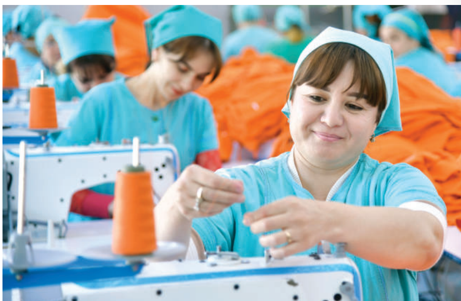
Bu chora-tadbirlarni o'z vaqtida jiro etish bo'yicha tizimli ishlar olib borilmoqda.

Prezidentning “2022-2026-yillarga mo'ljallangan Yangi O'zbekistonning taraqqiyot strategiyasi to'g'risida”gi farmonida ayollar ishsizligi darajasini ikki barobar kamaytirish, 700 mingdan ziyod ishsiz xotin-qizni davlat hisobidan kasb-hunarga o'qitish, ish bilan band bo'lmagan xotin-qizlarni tadbirkorlik va o'zini o'zi band qilish bo'yicha kompleks chora-tadbirlarni amalga oshirish vazifasi belgilangan. Bundan tashqari, kasb-hunarga o'qitish ko'lamini ikki barobar oshirish, bir million ishsiz fuqarolari kasb-hunarga o'rgatish va bu jarayonda nodavlat ta'lim muassasalarini ishtirokini 30 foizga yetkazish ko'zda tutilgan. Shuningdek, 2023-yilda 5 million aholi bandligini ta'minlash, 2 million doimiy ish o'rni yaratish masalasi ham kun tartibida turibdi.