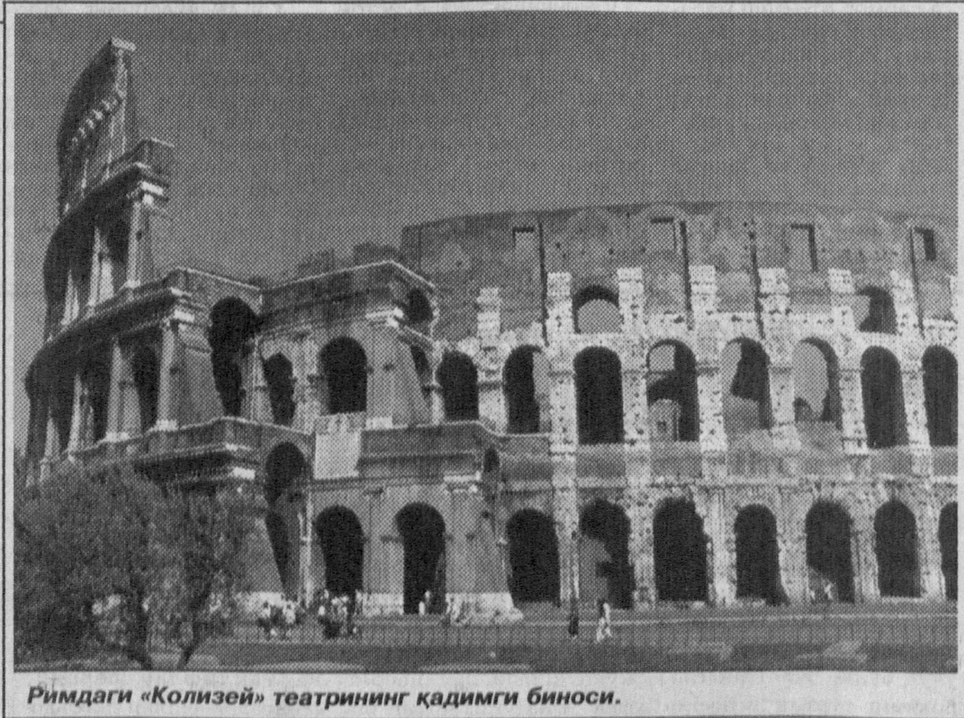
Римдаги «Колизей» театрининг қадимги биноси.

Сўнги вақтларда дунёнинг турли минтақаларида кечган ва давом этаётган молиявий-иқтисодий инкиролар демографияга таъсир кўрсатмай қолмади. Жануби-Шарқий Осиё, Шарқий Европа, Латин Америкаси давлатлари ҳукуматлари иқтисодий кийинчиликларни енгиш учун аҳолига тиббий хиз-