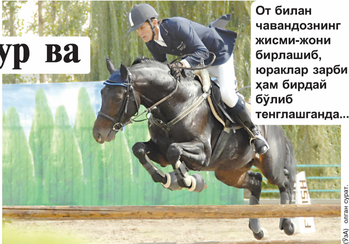
(ЎЗА) олган сурат.

— Бу ҳодисани сизларга айтётганим шуки, мабодо тун-