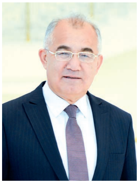
Акмад Саидов. Академик.