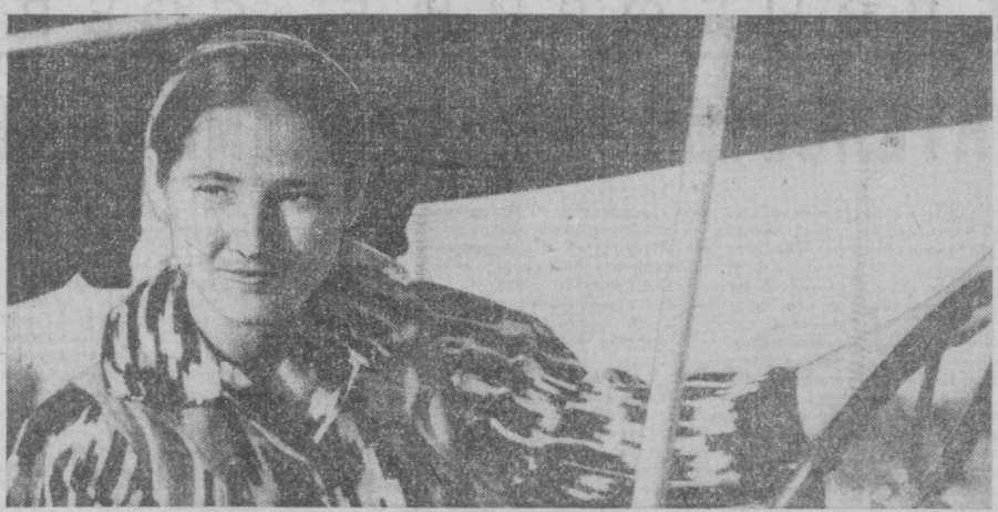
Доброе дело задумали выпускники средней школы колхоза «Ленинград» Пянского района...