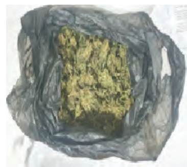
5 грамм опиума и 100 грамм гашиша.

Сотрудники органов внутренних дел разоблачают преступников, осуществляющих хранение и транспортировку наркотиков. К примеру, при проверке пассажиров автомобиля «Кобальт» на посту ДПС «Сангзор-15» в Галляаральском районе в кармане Х. Ш., жителя Шурчинского района Сурхандарьинской области, были обнаружены