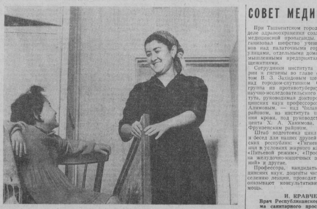
Тысячи семей ташкентцев, пострадавших от землетрясения, получили новые благоустроенные квартиры.

Многие аварийные дома расположены в районах города, поэтому будут реконструированы не скоро.