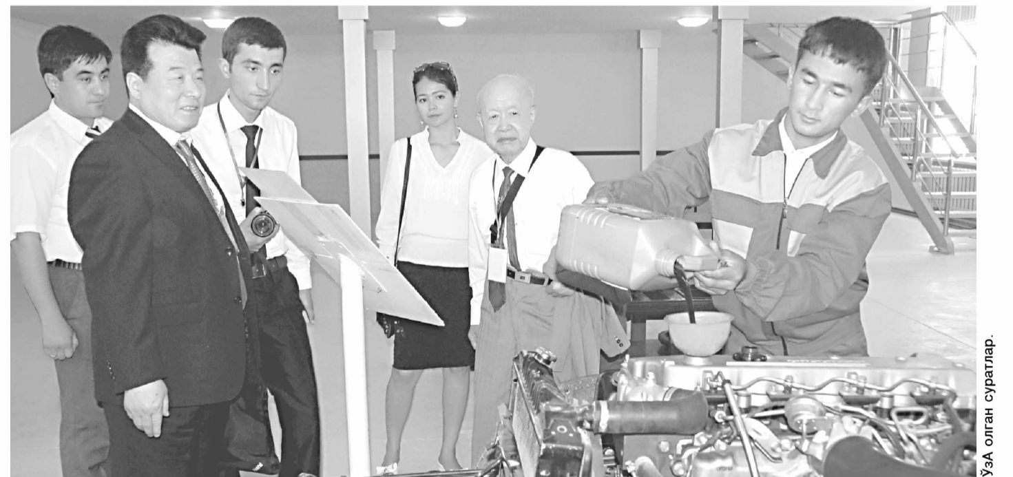
ЎЗА олган суратлар.

Анжуманининг шўъба мажлисларида Шарқ алломаларининг астрономия, математика, география ва геодезия каби аниқ фанлар шаклланишидаги ўрни, тиббиёт, фармакология, кимё ва минералогия сингари табиий фанлар ривожланишига қўшган улкан ҳиссаси, шунингдек, ўрта асрлар мутафаккирларининг тарихий ва философия мероси, тилшунослик ва адабиёт соҳаларидаги ютуқлари ҳақида сўз юритилди.