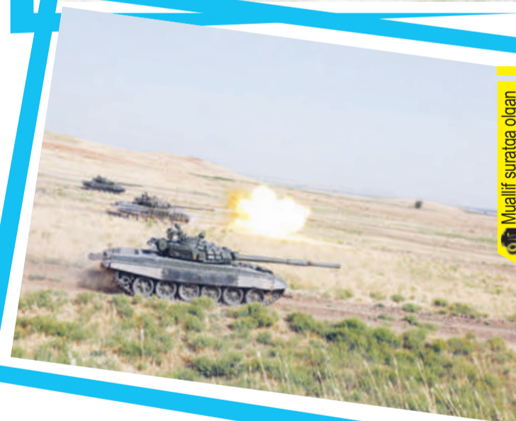
Muallif sur'atiga olgan

моҳирона бошқариш, белгиланган нуқталарда қисқа тўхташ ва ҳаракатни давом эттирган ҳолда нишонларни йўқ қилиш бўйича ўзларининг сўнгги синовларини амалга оширди. Кутилмаганда жанговар техникада юзага келган носозликни қисқа вақт ичида бартараф этиш бўйича ҳам кўникмалар шакланганлигини намойиш этишди.