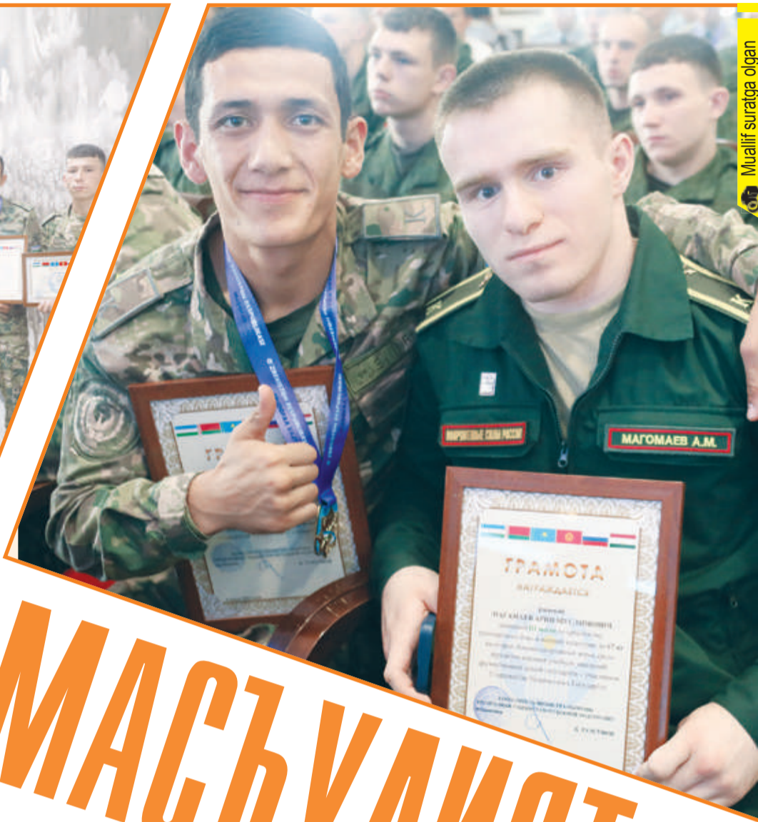
Muallif suraiga olgan