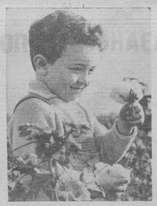
ПЕРВОЕ ЗНАКОМСТВО.

Целинники — народ упорный, стойкий и трудолюбивый. Много нужно сделать, чтобы вырастить на верхней целине высокий урожай «белого золота». И все это сделано. Отделение первым в хозяйстве рапортовало о выполнении плана хлопкозаготовок.