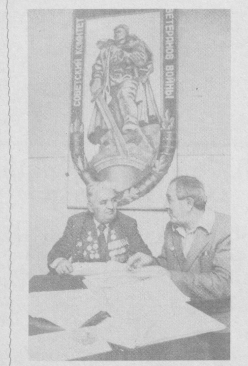
Буёқ Галабининг 40 йиллигига тайёрларлик даврида уруш ветеранлари Тошкент секцияси Совети комитети ишлари қиоғини наллага кирди.

СУЗИШ Америка Қўшма Штатларининг Фейетвилл шаҳрида сузиш бўйича калхоро мусобақалари бўлиб ўтди.