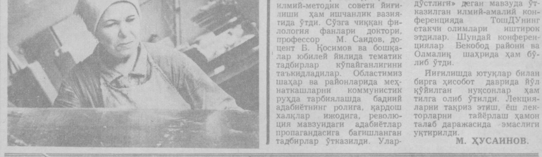
Тарбия ҳақида суҳбатлар