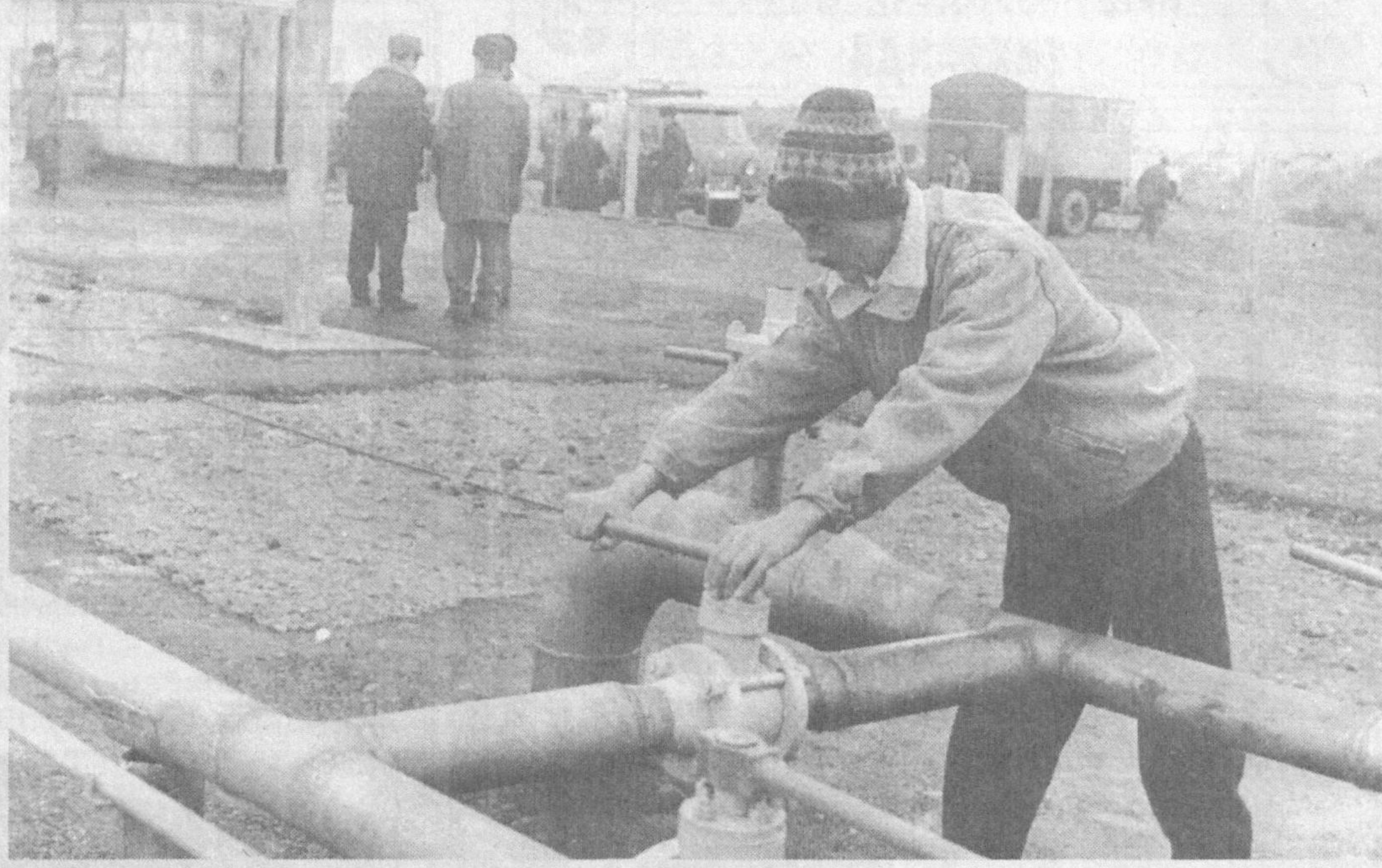
«Урганггазтранс» бирлашмаси аҳолини газ билан таъминлаш борасида хайрли ишларни амалга оширмоқда. Бирлашманинг Қорақалпоғистон республикасида олиб бораётган ишлари янада таҳсинга лойиқ. Айтиш пайтда бу ерда 6 та газ тақсимлаш ҳамда республиканинг шимолий ҳудудидagi станцияларда қурилиш-монтаж ишлари нудиясига етди.