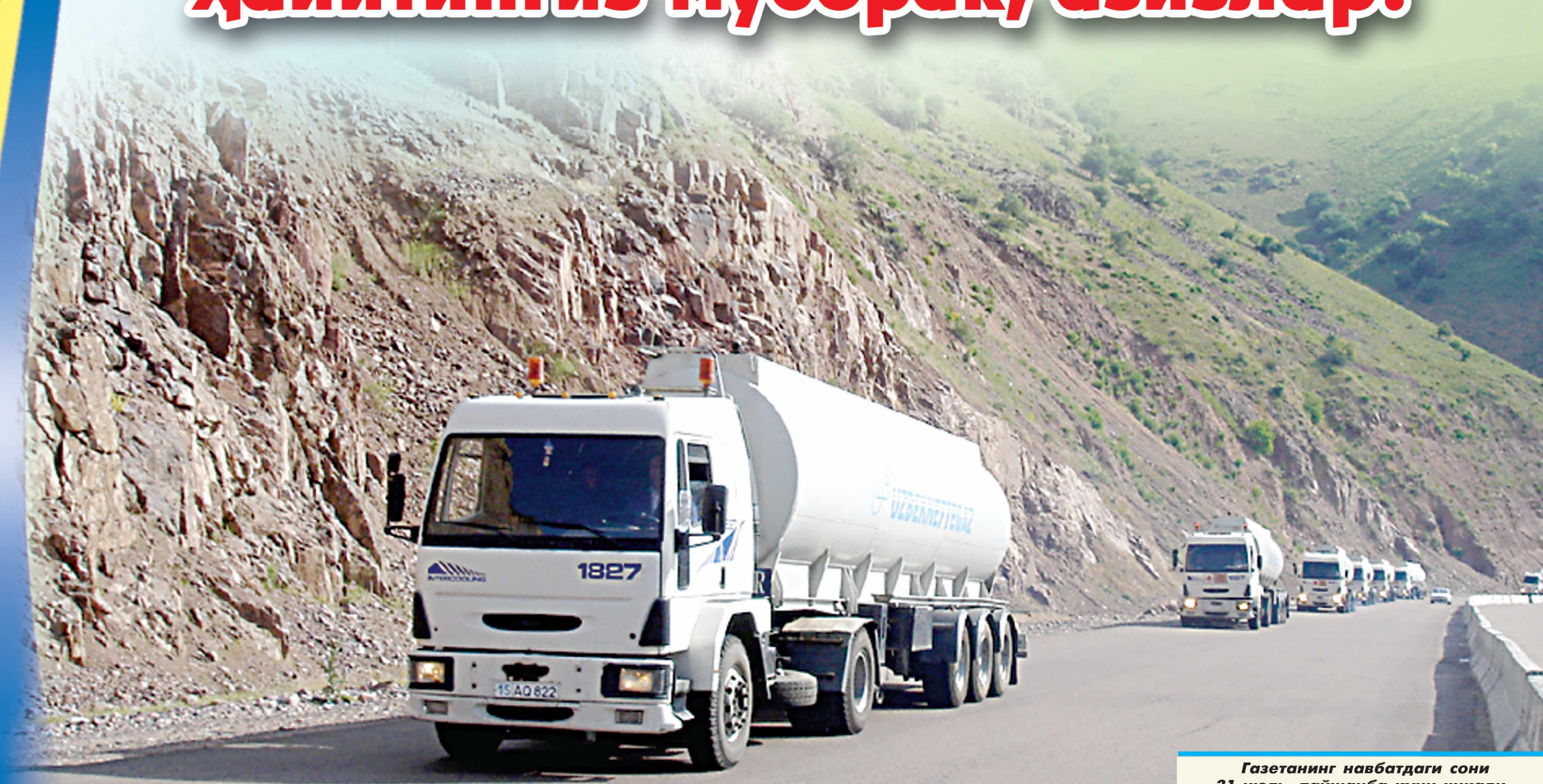
Газетанинг навбатдаги сони 31 июль, пайшанба куни чиқади.