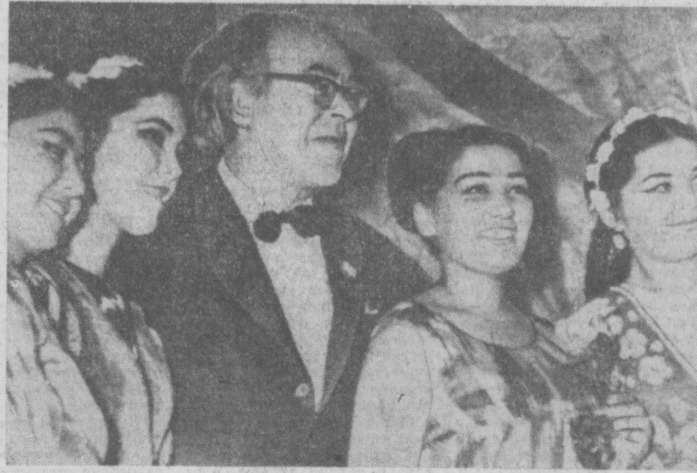
Народный артист Эстонской ССР, главный режиссер Таллинского театра юного зрителя В. Пансо с группой участников декады.