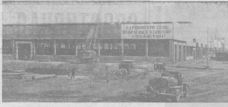
В городе Карши развернулось строительство нового комплекса завода по ремонту оборудования для осветителей Каршинской степи.

Ш. ЗАЙНУТДИНОВ. Спец. корр. «Правды Востока». Самарканд.