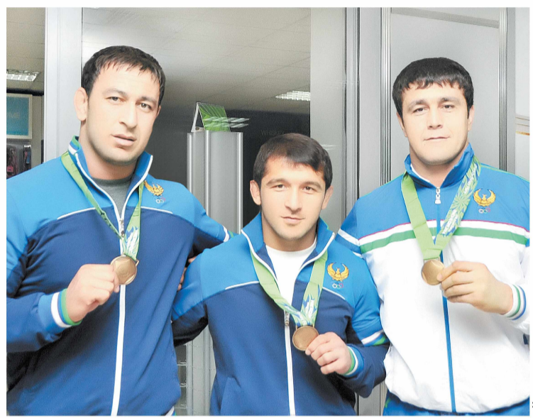
Ушбу олтин суратлар.