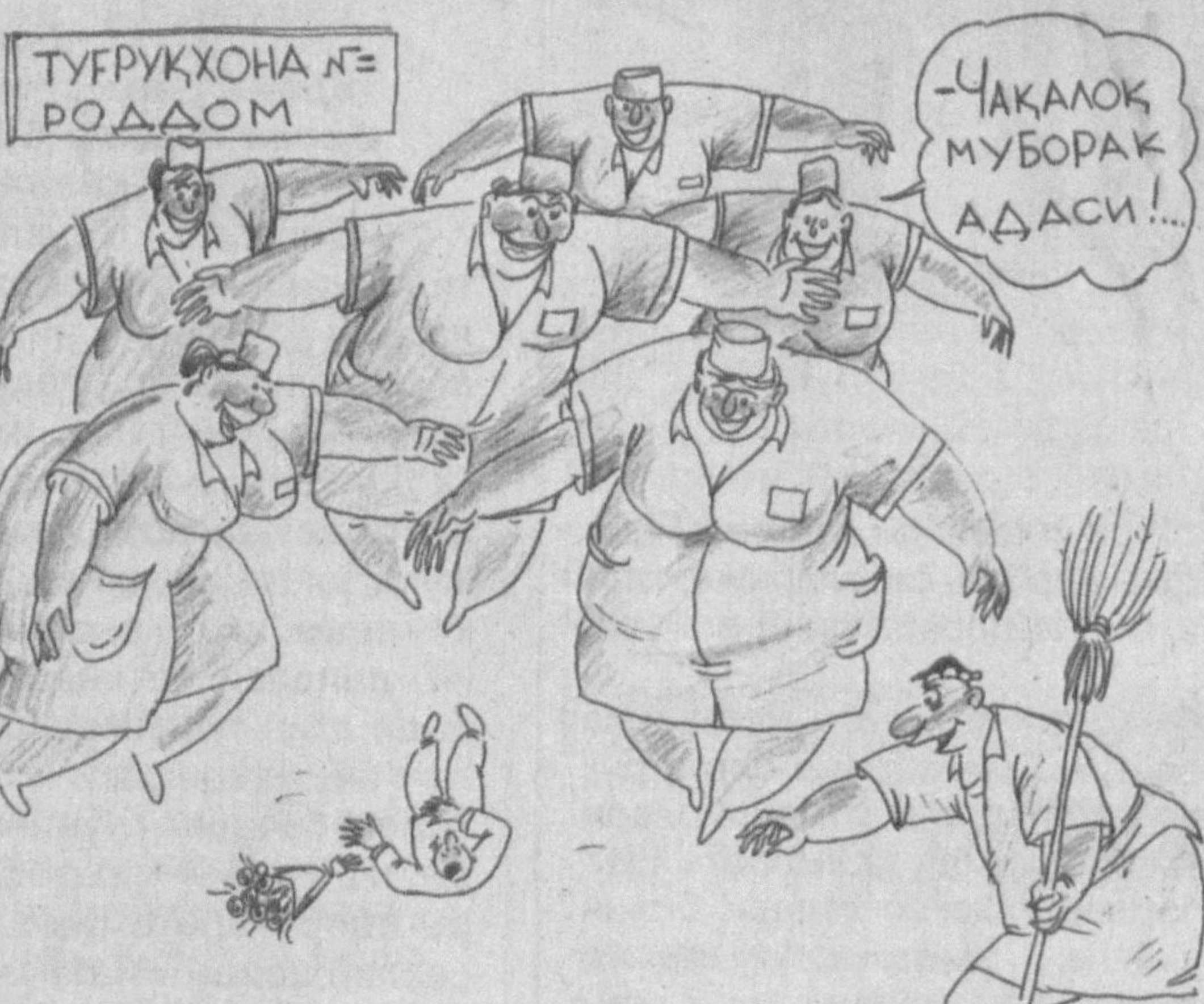
Рассом: Хусан СОДИКОВ

— Дада, ростдан ҳам мен тунда туғилганманми? — Ха, ўғлим, тунда туғилгансан. — Ҳарҳолда сизни уйғотиб юбормаган бўлсам керак. Йўқса, роса қалтак ердим-да?!