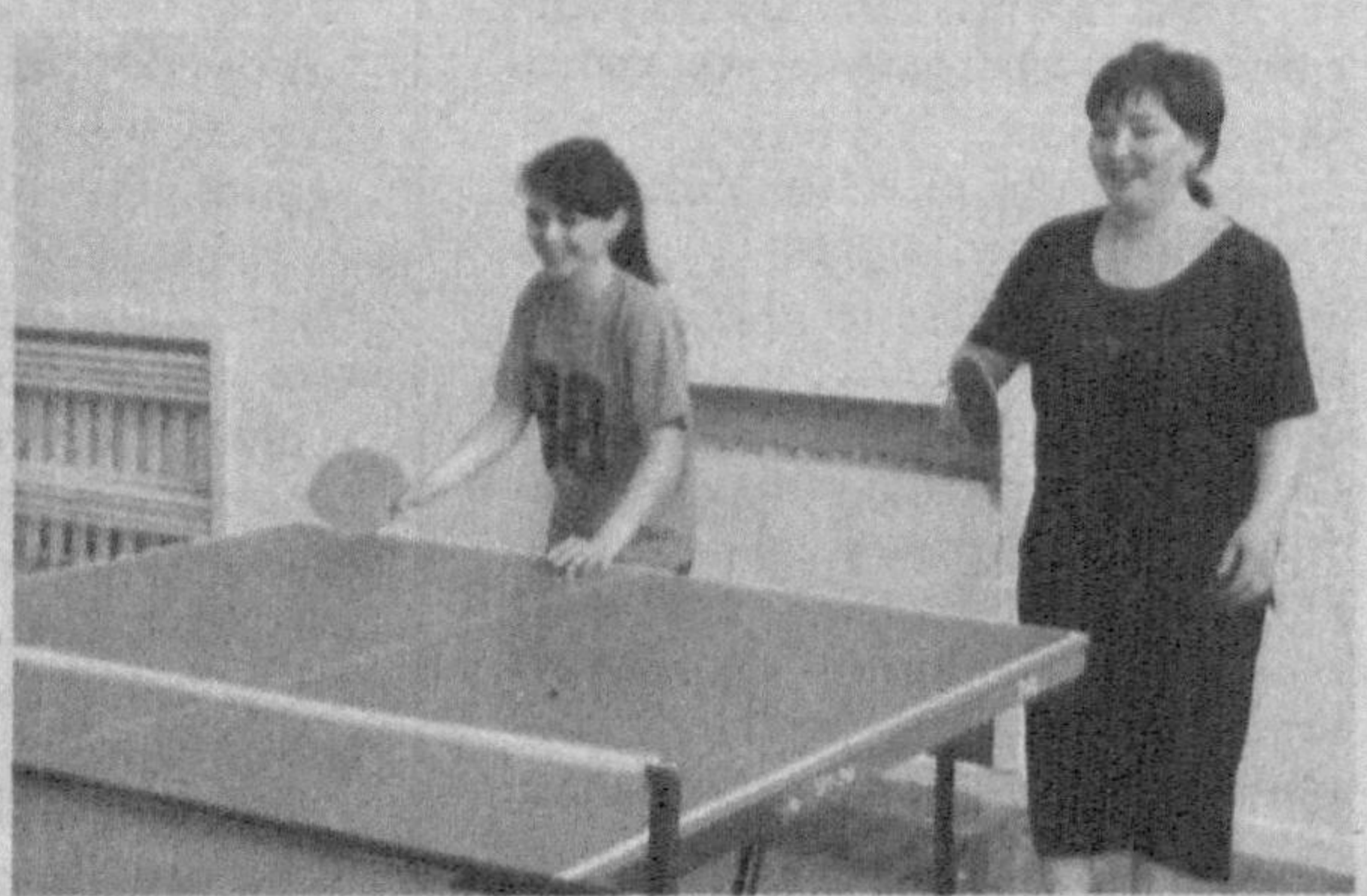
Таълим, фан ва маданият ходимлари касаба уюшмаси Учтепа тумани кенгаши тасарруфидagi мактаблар раҳбарлари ўртасида спорт мусобақаси бўлиб ўтди.