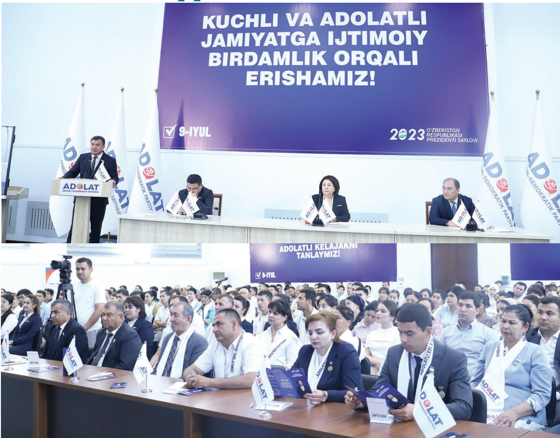
ХОРАЗМ ВИЛОЯТИ. Тошкент ахборот технологиялар университети Урганч филиалида Президентликка номзод Робахон Махмудованинг хоразмлик сайловчилар билан учрашуви бўлиб ўтди.

Тадбирни дастлаб, номзоднинг Хоразм вилоятидаги ишончли вакили – Ўзбекистон Республикаси Фанлар академияси вице-президенти, Хоразм Маъмун академияси профессори Икром Абдуллаев кириш сўзи билан очиб бериб, номзоднинг таржimai ҳоли, меҳнат фаолияти ҳақида маълумот бериб ўтди. Номзод ўз Сайловди дастурида давлат ва жамяят тараққиётига, фуқаролар фаровонлигига дахлдор изчил тақлифлар илгари сурилатганлиги айтиб ўтди.