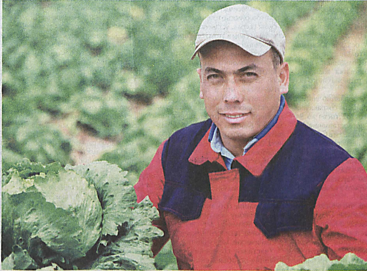
Благоприятные почвенно-климатические условия нашей солнечной страны позволяют в течение года получать по два, а то и по три урожая овощей, бахчевых и других сельскохозяйственных культур.

Обществом с ограниченной ответственностью "BIG Agro" налажен экспорт салата "айсберг", выращиваемого на 100 гектарах площади Миришкорского и Касбинского районов Кашкадарьинской области. Сорт салата "айсберг" подобен белокачанной капусте, его листья располагаются не очень плотно. Вес одного кочана салата составляет 800 граммов - 1 килограмм. Этот вид салата богат витаминами А, В, С и Е, а также содержит такие полезные элементы, как калий, фосфор, железо.