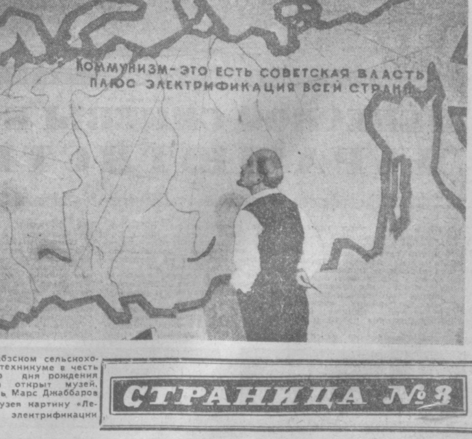
КОММУНИЗМ — ЭТО ЕСТЬ СОВЕТСКАЯ ВЛАСТЬ ПЛЮС ЭЛЕКТРИФИКАЦИЯ ВСЕЙ СТРАНЫ