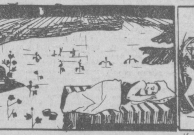
Пока поливальники спят...