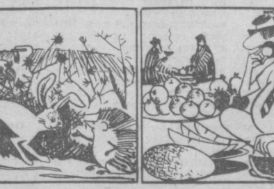
— А нам сорняки нравятся.