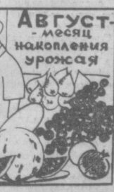
Август — месяц накопления урожая