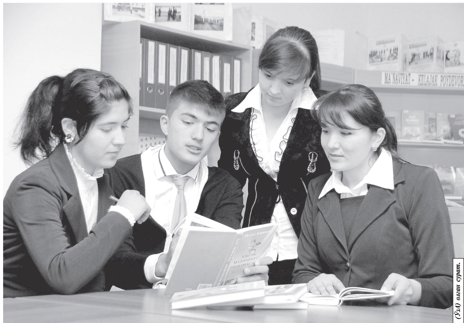
(ЎзА) оқибат сурати.

Қашқадарё вилояти Косон туманидаги саноат касб-ҳунар коллежида 1152 ўқувчи ишлаб чиқаришнинг турли тармоқлари бўйича касб эгалламоқда.