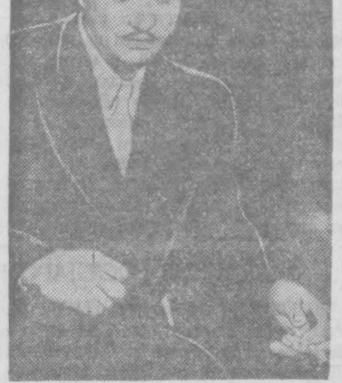
Гарри Смит — народный артист Узбекской ССР Шуккур Бурханов.

Постановка «Русского вопроса» в театре еще одно свидетельство правильности его творческой линии, направленной на разрешение задач, поставленных ЦК ВКП(б) перед советским театральным искусством.