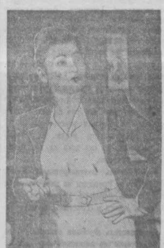
Джесси — народная артистка Узбекской ССР Сара Шангураева.

Успешно справились со своими ролями заслуженные артисты республики Наби