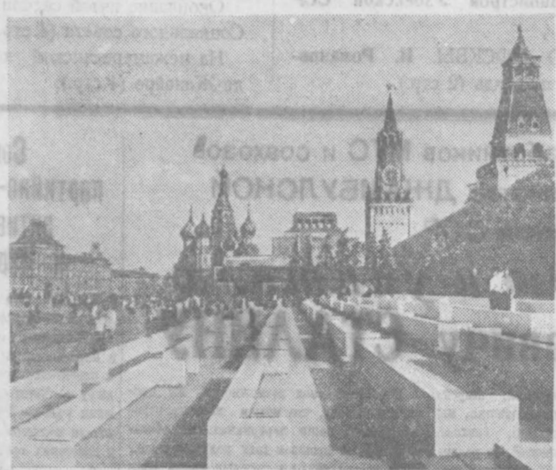
МОСКВА. Красная площадь.

Почти восемь столетий существует Красная площадь. В неповторимом очаровании сложилась здесь следы многовековой истории Москвы — столицы и сердца великого русского народа. В Москве скрещивались великие торговые пути древности: путь из Византии в Европу, богатого Востока, и путь в Великий Новгород и Псков, которые уже в те далекие годы вели оживленную торговлю с Западной Европой, путь на обширную хлебную Волгу и по ней на юг, в Азию; путь с Волги на Смоленск и отсюда по Днепру на Киев