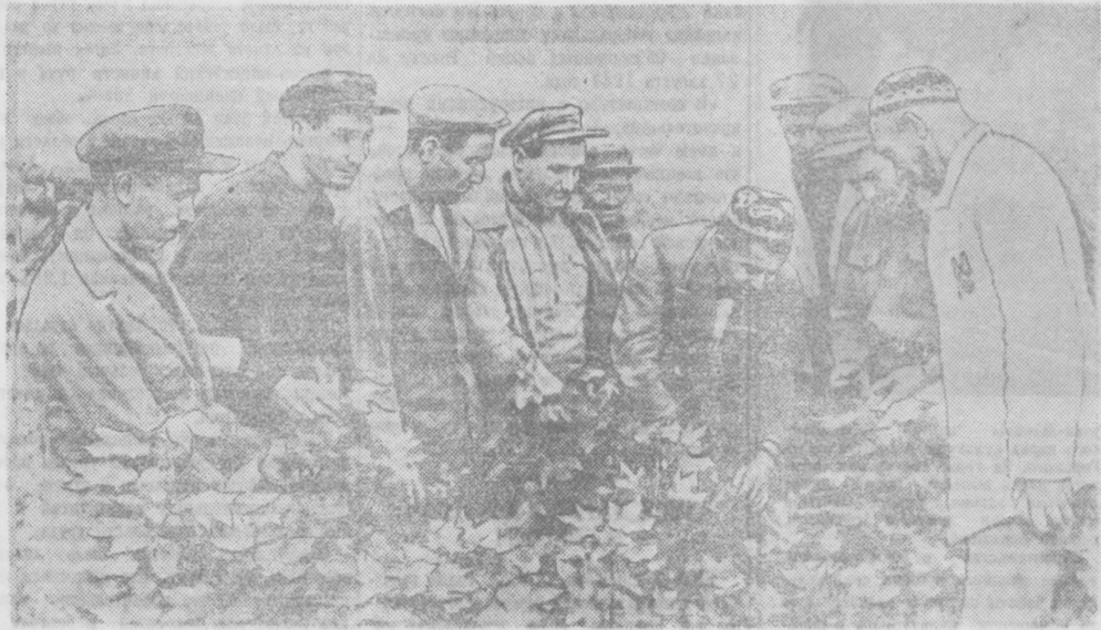
Делегация ягньюльских колхозников совместно с азербайджанскими колхозниками осматривает хлопок на полях колхоза им. Агамалы-оглы, Карагинского района.

День великого праздника советского народа — 30-летие советской власти — мы встретим новыми трудовыми победами.