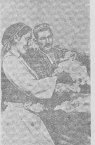
В колхозе «Азия», Ак-Курганского района, Ташкентской области, началась выборочная уборка шовтного хлопка.

Большие потери при перевозках — второй крупной недостаток первых дней уборки. Лагунские дороги, ведущие к Файзабадскому заготовительному пункту, сплошь усыпаны хлопком.