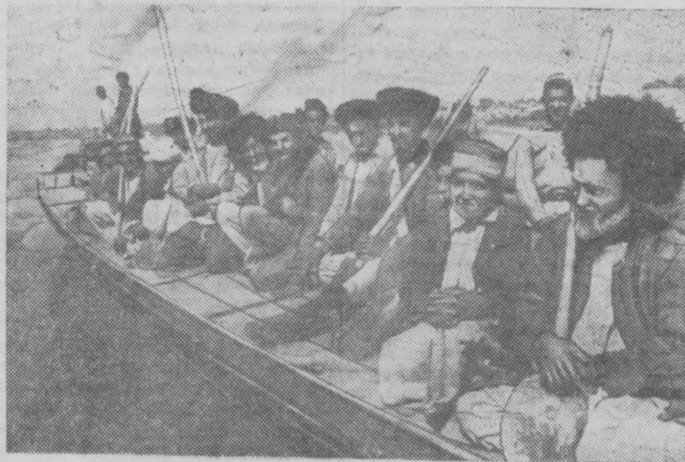
1. Колхозники-строители отправляются на барсаках к месту работы. 2. Колхозники на отсыпке железнодорожного полотна.