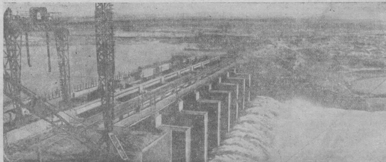
ПЛОТИНА ФАРХАДСКОГО ГИДРОЭЛЕКТРОСТАНЦИИ

ные, поселковые Советы депутатов трудящихся Киргизской ССР на воскресенье, 11 января 1948 года.