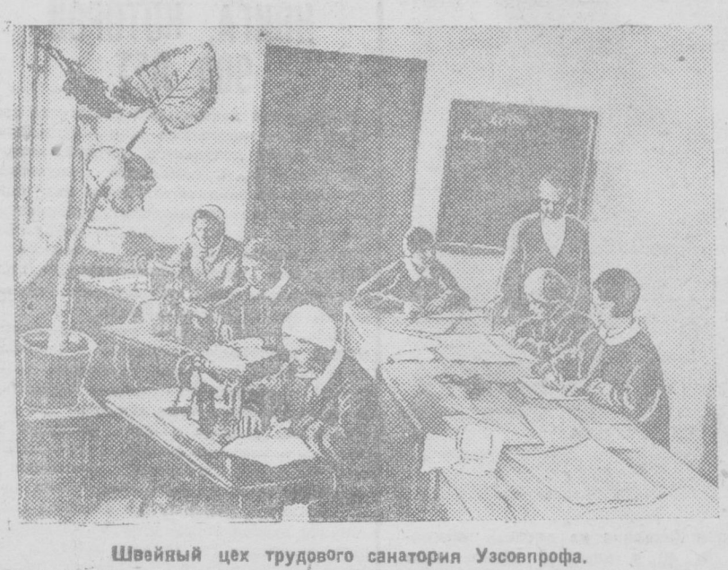
Швейный цех трудового санатория Узсовпрофа.

свершит восхождение на ближайшую гору. Не могу удержаться в патристический сад и аэрион. Дем почитать книгу Алексея Толстого «Питер первый».