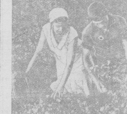
Семья тарифовода Текстильного комбината Гидковское получила 800 кв. метров земли под огород.

Поселили картофель, кукурузу, помидоры, фасоль, НА СНИМКЕ: Гидковская с сыном собирают картофель.