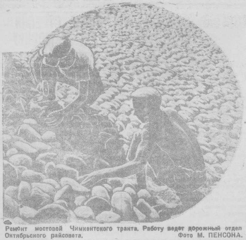
Ремонт мостовой Чимкентского транта. Работу ведет дорожный отдел Октябрьского райсовета.