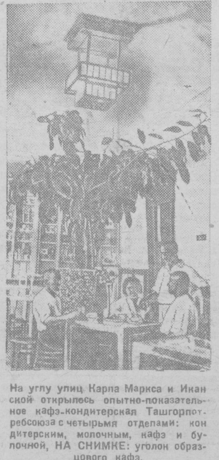
На углу улиц Маркса и Имановой открылось опытно-показательное кафе-кондитерия Ташгорпол.