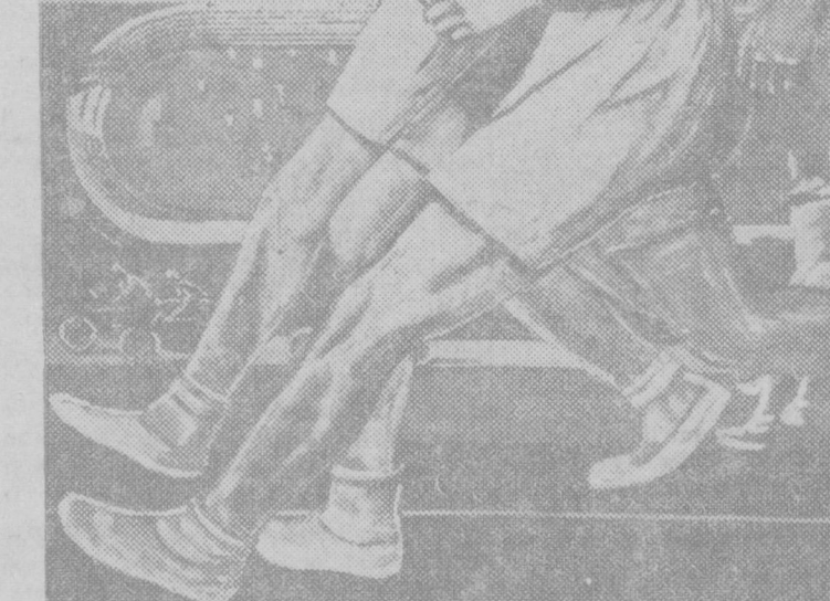
К всеобщей спартакиаде профсоюзов Изюгия выпустил многокрасочный плакат работы художника В. Корочко — «Советские физкультурники — гордость нашей страны». НА СНИМКЕ: плакат Изюгия.

гие машины, и сказали: «Дайте нам десять минут сроку, мы хотим сделать одну вещь». Подождали. Через десять минут дорога была приведена в такой вид, что по ней могла пройти одна машина. И русские товарищи проскакали по ней, провозимые приятностями рабочих. Немедленно вслед за этим все следы импровизированной дороги были уничтожены и все происшедшее скрыто от посторонних глаз. Этот факт необычайно ярко характеризует настроение венских рабочих, их отношение к советским гражданам. Трудно передать, с каким волнением и гордостью рассказали нам шофер об этом случае. Приехали в Париж. Мне очень хотелось увидеть французскую деревню. С другими нашими товарищами поехали не удалось. Они были очень заняты. Но я опять-таки нашел одного знакомого, и он по моей просьбе повез меня в ближайшую деревню. В деревне под Парижем не пришло, как у нас, войти в любой дом и спросить о ком-нибудь. Там в каждой деревне три-четыре ресторана. Что делать? Надо же пойти какой-нибудь предлог, чтобы разговаривать с жителями. Все же входим в один дом и застаем там семью, окруженную детьми, очень приятными, очень бедными детьми: увидели вас, горлазо более приятными, чем дети старого Таджикистана. (Смех в зале). Сравниваем ее, пейзаж на получила несколько стаканов молока. Она отпахивает нам, стаяла, на ресторанах. Мы продолжаем по своим дорогам, что нам очень хочется