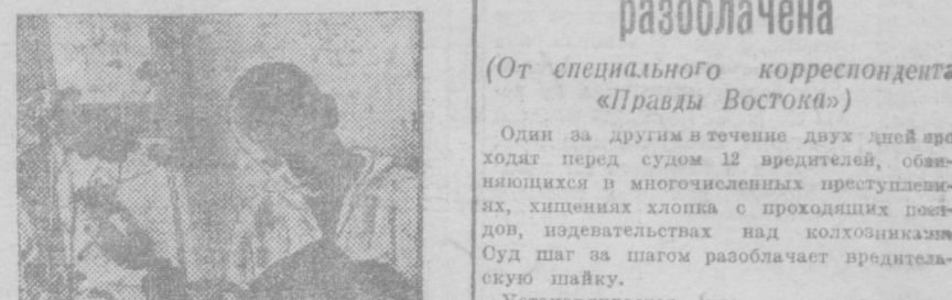
В КОМНАТЕ ДОШКОЛЬНИКА.