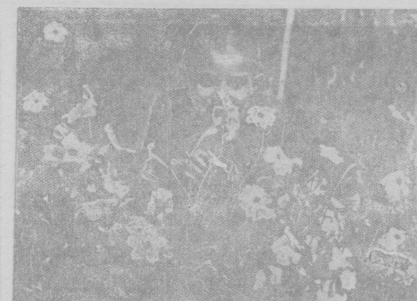
В цветнике пионерского лагеря ННАД.

Вновь слышу И ухожу за скалы, Но в груди и до сих пор пошу Бубенцы, что нежно зубокают, И слова, что пел старик-ашуг.