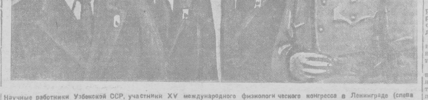
Участники конгресса, заседающего в Ленинграде.

Наш мотыльный ученый Иван Петрович Павлов имеет колоссальнейшие заслуги перед человечеством. Шестнадцать лет академика Павлова работала в области физиологии. За это время он открыл массу открытий, далеко выходящих за пределы науки.