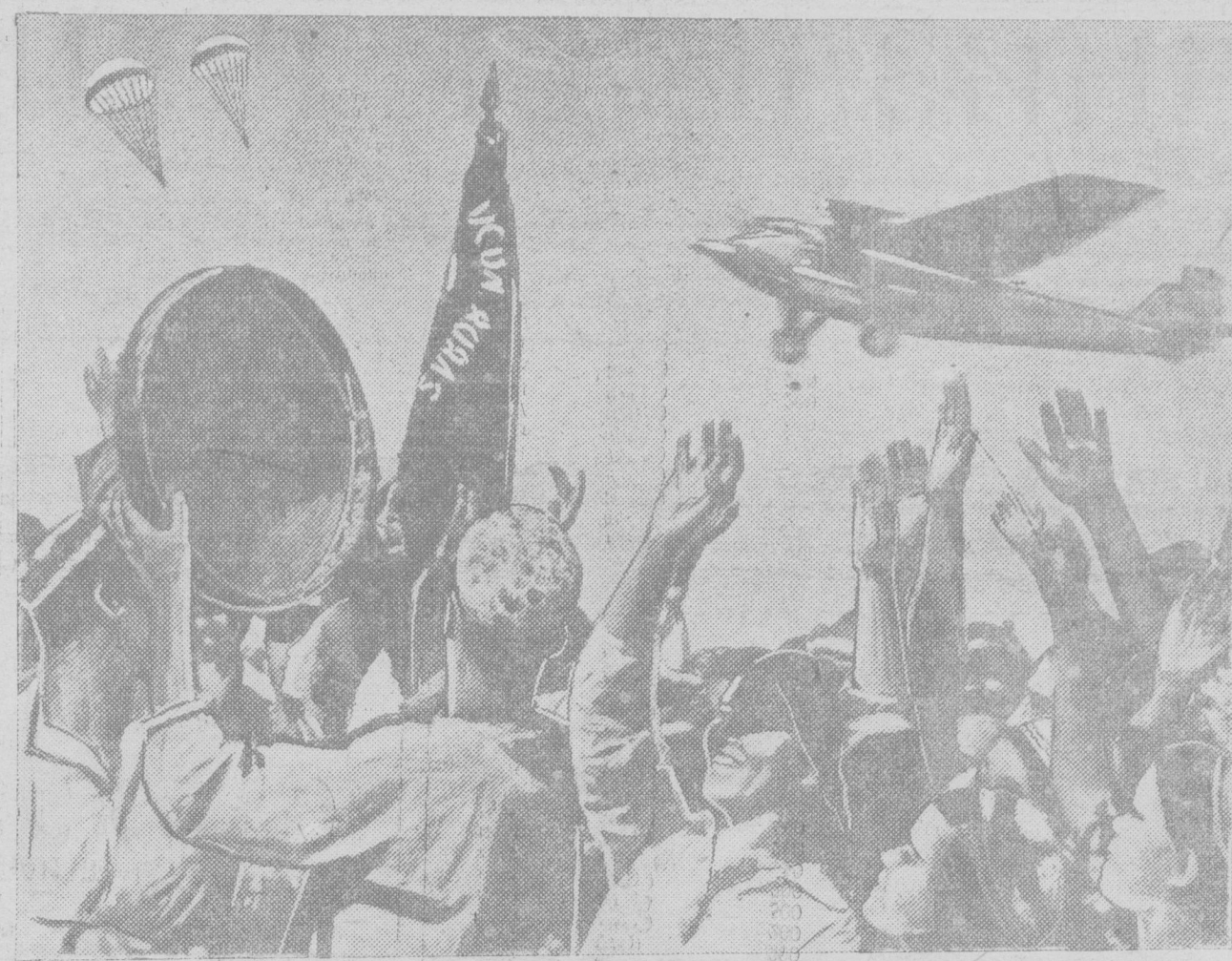
18 АВГУСТА НА АЭРОДРОМЕ.