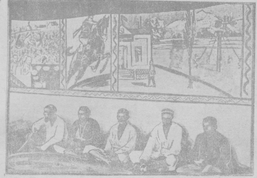
В новой красной чайхане имени Мопотова, Ленинского района, стены украшены молодыми колхозными художниками ТУРСУНОВ АБДУЛЛАЕВИЧ.