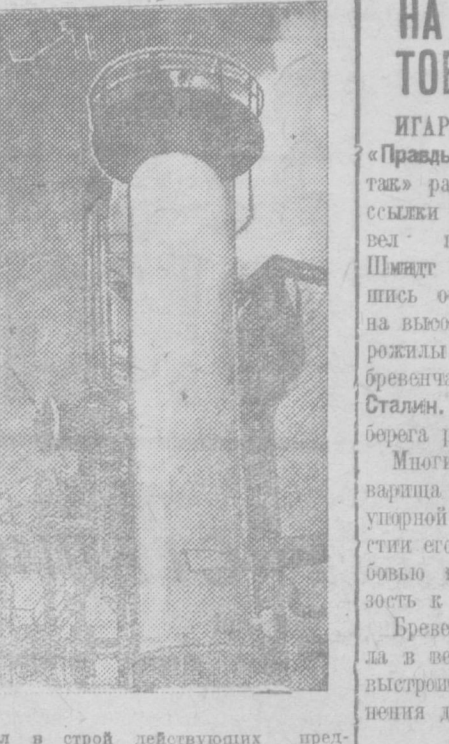
Группа из строя действующих предприятий завод карбонных кислот при комбинате им. Вавилова. На заднем плане колонны для регенерации лигнона.