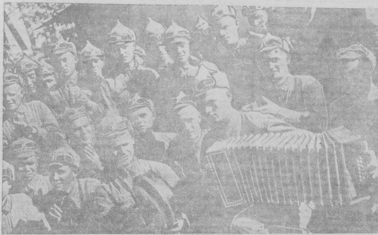
Памирцы на привале.