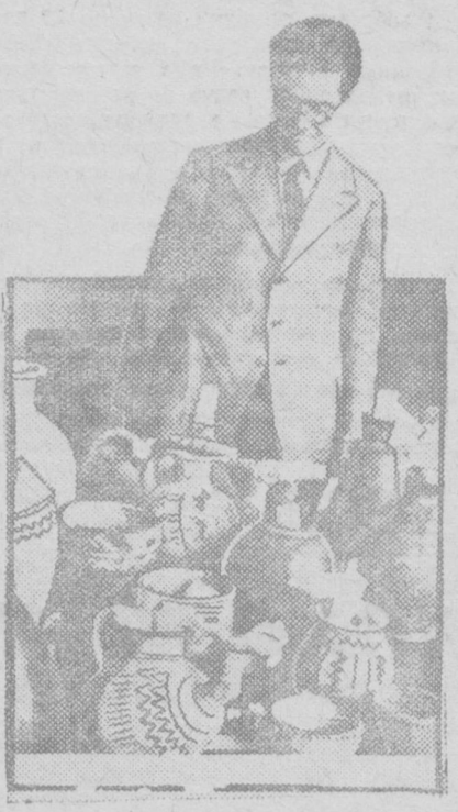
К III международному конгрессу по иранскому искусству и археологии в Ленинграде.

ЛЕНИНГРАД, 11 (УзТАГ). Сегодня в 4 часа дня в 3-м театральном театре открылся третий международный конгресс по искусству и археологии Ирана. Участником делегата конгресса, прибывшего из 26 стран мира, советские работники, представители советской общественности и искусства.