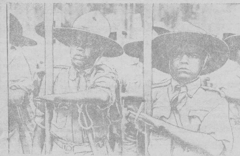
АБИССИНСКАЯ ЮНОШЕСКАЯ ОРГАНИЗАЦИЯ. Абиссиния ввела у себя бойкот, но существует созданная итальянской властью шпарка джентри в интернировании, являющаяся основой для подготовки к офицерскому званию. После 5-летнего обучения, под руководством европейских инструкторов, эти юности превращаются в командный состав для модернизации армии. НА СПИМКЕ: Абиссинские солдаты.

силу этого не могут регулярно покупать и доставлять в деревню товары. Имеют место большие текучесть кадров, массовое нарушение выборности руководящих органов селько, совершение по недостаточному участию райкомов и разрешения основных вопросов работы селько. Организационная структура Центросоюза и райсоюзов и практика их работы не соответствует усложняющимся и выросшим задачам сельской торговли и тем изменениям, которые произошли в городской торговле. Уже два года, как в городе работают крупные заводы и целые отрасли промышленности обслуживаются не кооперацией, а организациями вместо нее ОРСами (отделы рабочего снабжения при предприятиях). За это время гитантика выросла в городах и улучши-