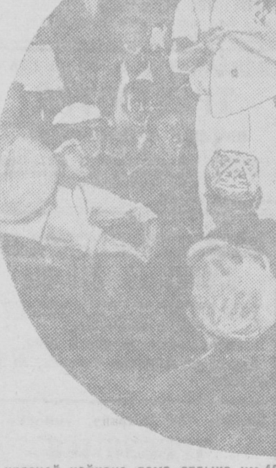
В красной чайхана дома отдыха им. 10-летия Октября (в. Троицкое) громком чтении газет вошло в систему массовой культуры.