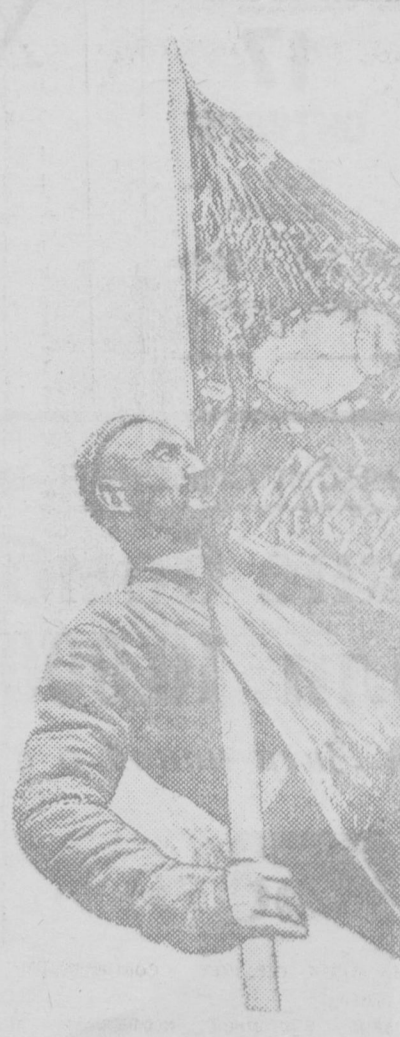
Председатель артели им. Тюрбебаева...

А. ГЛУХОВСКИЙ. «Коммунист Таджикистана».