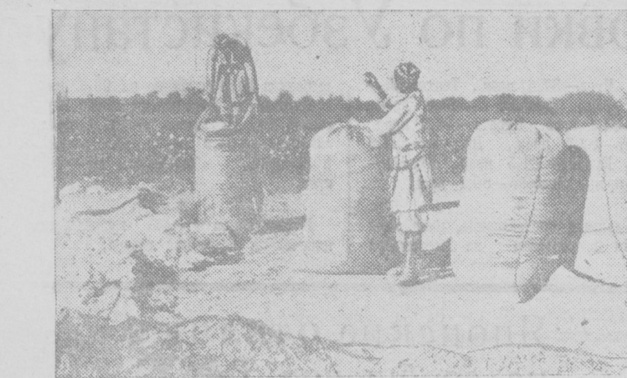
Колхоз им. Икрамова (Ленинский район). На кирмане 11-й бригады приготавливают сырец и отправляют на заготовку.

Ф. А.) составляет бедняки, потерявшие полученные ими от предков земли («Мансио-инпо», 11 апреля 1935 г.). Во всяком случае, в деревню послышались «политико-просветительные партии», которые «спартачили» все силы на усиление и тренировку уездных полицейских отрядов и упорядочение связи и транспорта, и в задух которых ходит «разрушить вредные связи бедняков и крестьянства, аналитическую систему «бао-пан» (круговой поруки—Ф. А.), организовав дружные самоубийства» («Мансио-инпо», 25 мая 1935 г.). Вот уж поистине борьба не с голодом, а с голодающими!