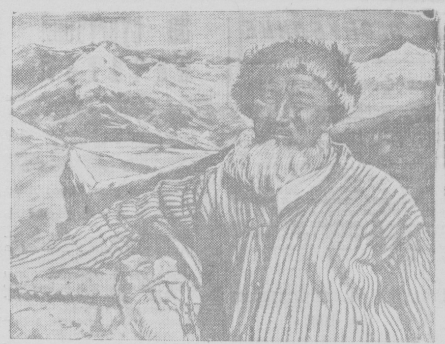
Жители Памира. Погощники кутасов.