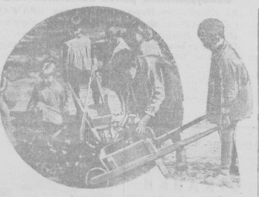
В детском саду им. Ворошилова. Дети собирают листья в своем саду.

В приказе перечислены конкретные мероприятия по ремонту тракторов, подлежащих капитальному ремонту, и указаны сроки окончания осенне-зимнего ремонта тракторов: к 20 февраля ремонт должен закончить Крымская АССР, УзССР, Азово-Донская область, Северная Кавказская область, Казахская АССР, Омская АССР, Саратовская АССР, Пензенская АССР, Воронежская, Курская, Донецкая, Харьковская, Киевская, Винницкая, Черниговская области и Краснодарский край АССР, в том же месяце, край и область ремонт тракторов должны закончить к 15 марта.