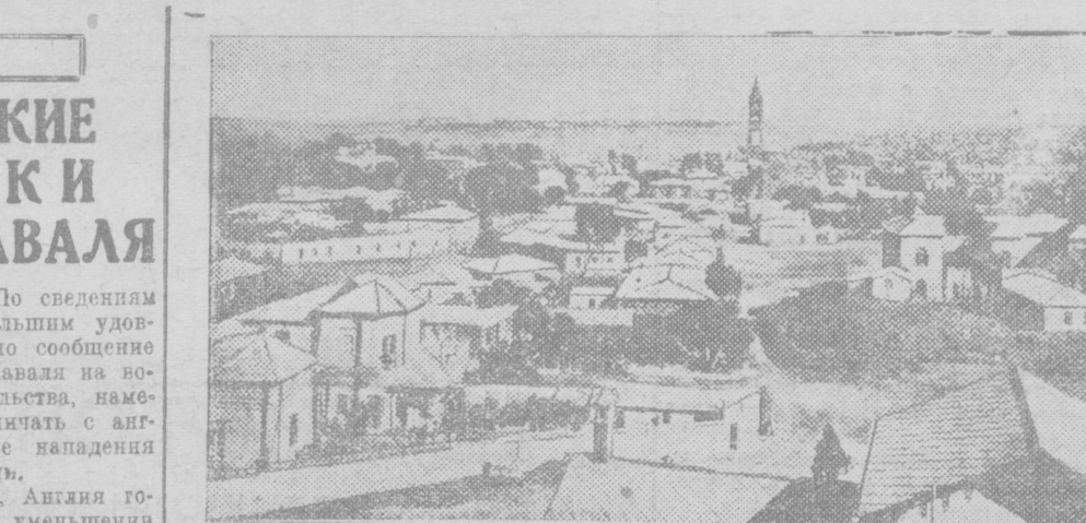
НА СНИМКЕ: г. Асмара, столица итальянской колонии Эритрея, откуда начались наступление итальянских войск с севера.

«Использовали ли итальянцы современное оборудование в бою под Уал-Уалом? Они применяли и самолеты и танки. То, что летчики могли летать над самыми передовыми линиями сейчас же после начала военных действий, не внесло никакой пользы в абиссинскую армию. Она залос, что абиссинцы воюют не бросаясь в страхе прочь при виде самолетов, хотя они никогда не видели летающих машин. Итальянцы подгадали, что самолеты произведут на абиссинцев страшное впечатление. Вместо бегства абиссинцы спокойно встречали итальянские танки, на-ходу выходявшие на них и убивая их выстрелами. В этом бою они показали исключительное бесстрашие. Только смерть может остановить движение абиссинцев...»