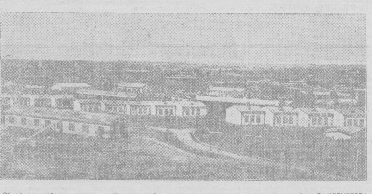
Общий вид рабочего городка на Наварынской электростанции.

Перепланировка Самарканда Упланировка в этом году приступает к перепланировке Самарканда. В связи с намечающимися в Самарканде строительством новых и реконструкцией существующих предприятий (шелкоткацкая фабрика, завод «Декалкан») перепланировка обеспечит правильное развертывание городского строительства. На перепланировку отпущено 500 тысяч рублей.