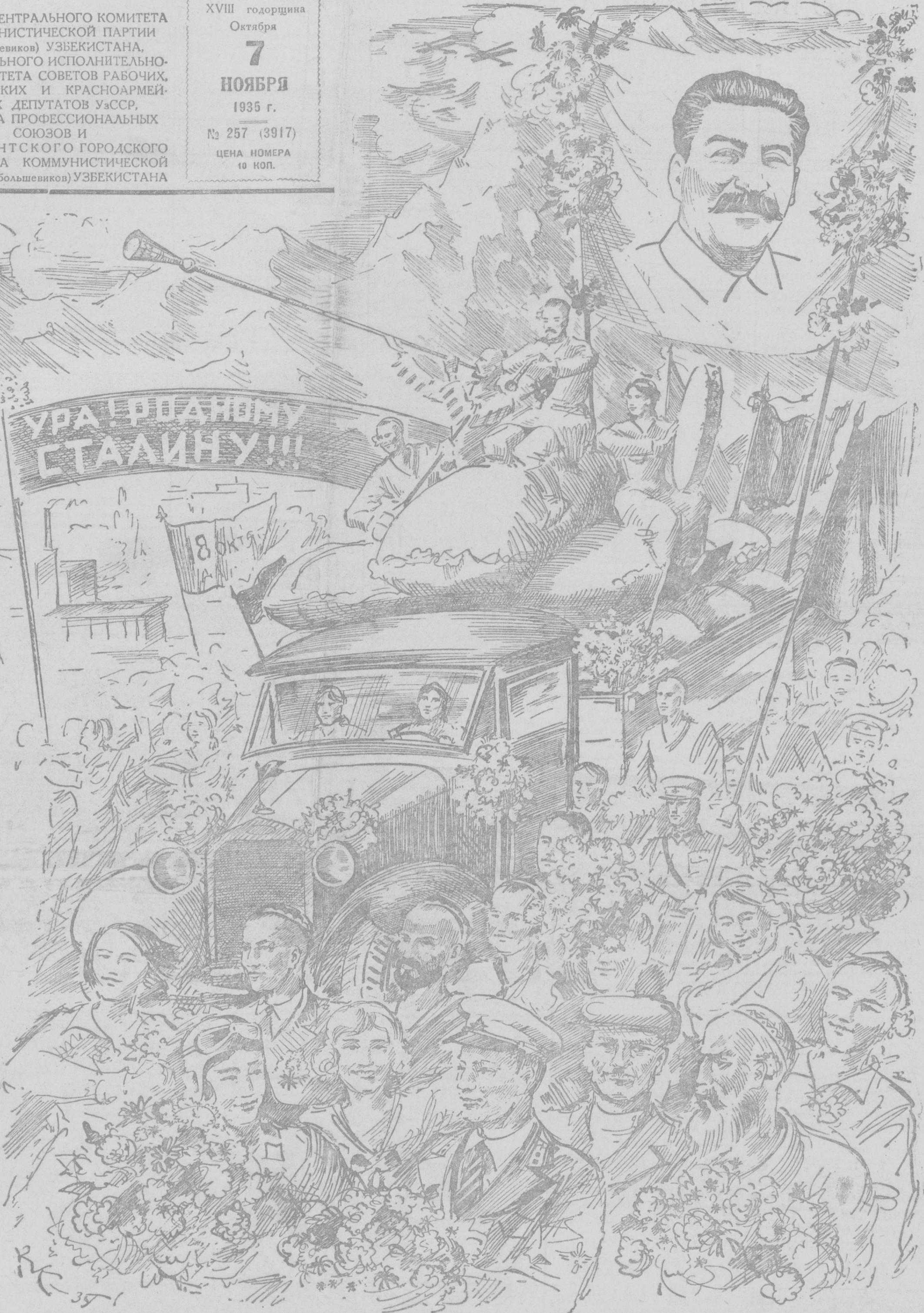
Рис. худ. В. КАЙДАНОВА.